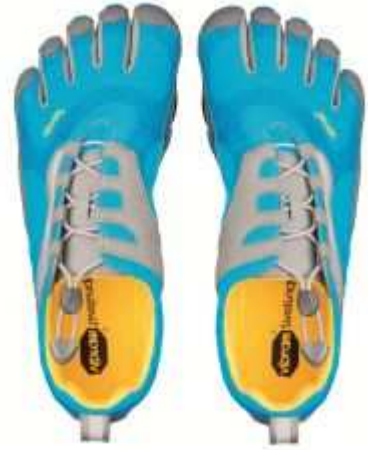
De Vibram 5Fingers

Verder wordt uit de doeken gedaan hoe Nike en andere fabrikanten bewust elke tien maanden de best verkopende schoenen uit de schappen haalt. Niet om de schoen te verbeteren zoals wordt gesuggereerd, maar om de winst te verhogen. Het is de bedoeling de verkoop stevig op te schroeven door hardlopers te verleiden twee, drie of vijf paar tegelijkertijd te kopen, een voorraadje voor het geval hun favoriete modellen uit de handel verdwijnen. Er valt trouwens weinig te verbeteren, want de beste verbetering is geen schoenen . Zelfs Nike leek dat toe te geven en stelde zich tot taak als schoenenfabrikant geld te verdienen aan geen schoenen . Zo verschenen de nieuwe minimalistische loop pantoffels op de markt, met als nieuw topmodel de Nike Free Run en de Vibram 5Fingers. Met de slogan 'ren blootsvoets', maar nog altijd met een prijskaartje van rond de €100. Runnersworld is nog niet overtuigd, want 5Fingers kon ik er niet vinden. Of is de winst daarop niet voldoende?